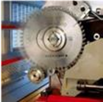
Mécanisme de lame inciseuse VSA Scoring unit à courroie avec " lame double" VSA-C.